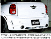
1リアローワーアブリア、純正リアローワー下板を積み込んで、ボディデザイン、フロア同様にセンター部分のみカーボンとミニ Cooper S専用