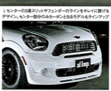
1 センターの過入リットとファンターのラインをレイに繋げるデザイン。センター部分のみカーボンもモデルもラインアップ