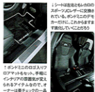
1シートは高座席のためのスポーツシートのリニアに接続されている。ボディはこのデザインを大切に、手前にはインテリアが非常に美しく、さらにはアイテムなので、オーナーは豪華なクルマ