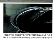
1 真正のインダにこだわっており、下盤の鉄板上にダンプリングを装着することで小さいホイールながらもしっかりとスポーツ感を演出